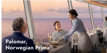
Palomar, Norwegian Prima®

Se incluye un entrante, una sopa o ensalada, un plato principal y un postre por cena.