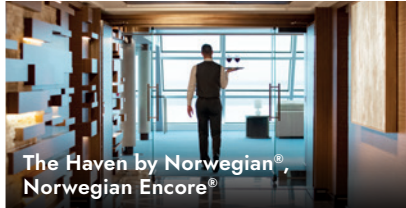
The Haven by Norwegian® Norwegian Encore®