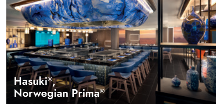
Hasuki®, Norwegian Prima®