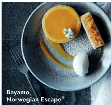
Bayamo, Norwegian Escape®