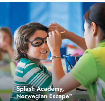
Splash Academy, Norwegian Escape®