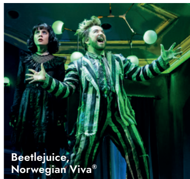
Beetlejuice, Norwegian Viva®

Para un crucero al precio más económico, tus clientes eligen la tarifa básica con los servicios incluidos mencionados arriba y pagan por los extras a bordo.